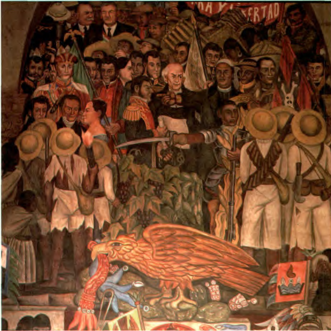
Diego Rivera, fragmento del mural Palacio Nacional, México, D.F. Siglo XX.