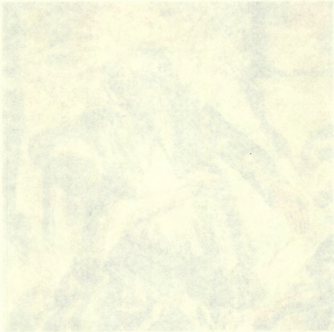
Don Miguel Hidalgo y Costilla