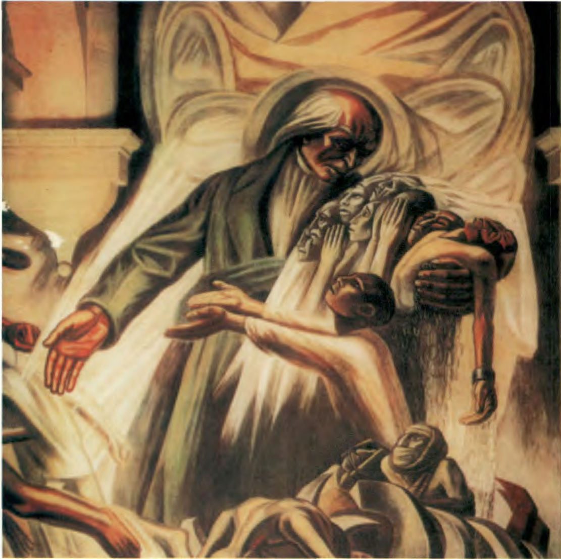
José Chávez Morado, fragmento del mural Museo Regional Alhóndiga de Granaditas Guanajuato, Gto. 1966.